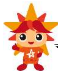
アビリンピック マスコットキャラクター アビリス