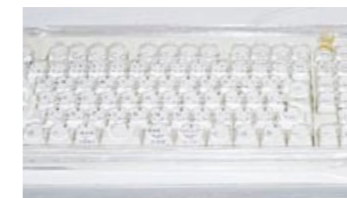
▲依頼を受けて制作したキーボード入力用のプロテクトカバー。丸い穴が付いており、誤入力を防ぎます。

バーチャルメディア工房ぎふは、中部圏の一大IT拠点であるソフトピアジャパンに平成10年に設立。ITを活用した重度障害者の在宅就業を行う団体として、WEBサイトの構築、各種印刷物制作、ソフトウェア開発、ネットワーク構築などの仕事に加え、IT関連の人材育成・研修にも力を注いでいます。「私たちは福祉用具等の共同開発にも