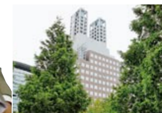
岐阜県大垣市にあるソフトピアジャパン。人材育成、産業高度化などを主な機能として約140社が活動しています。