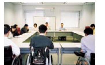
▲2カ月に一度開かれる在宅ワーカーのミーティング。仲間同士の情報交換も盛んに行われています。