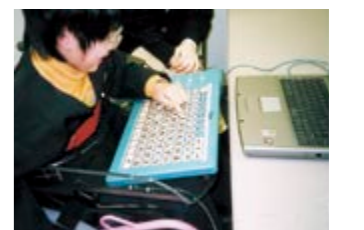
視覚障害、身体障害があっても入力しやすいキーボード。他にも障害に合わせた道具の開発・改良を行っています。