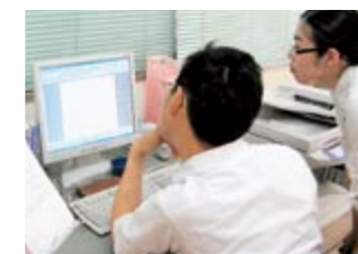
就労支援事業では一人ひとりのレベルを指導員が把握して適切な指導をするようにしています。