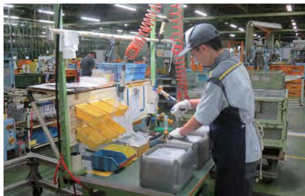
発達障害のある社員が働く様子

さらに、障害の種類や程度だけで難しいと決めつけず、さまざまな仕事にチャレンジしてもらうようにしている。