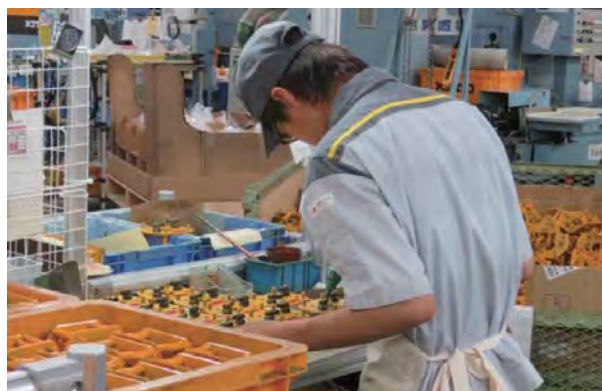
知的障害のある社員が働く様子

従事職務は、本人が施設などで経験した仕事とキトーの仕事が一致することは少ないため、「 何ができるか 」ではなく、「 どうしたらできるか 」をみんなで考えている。