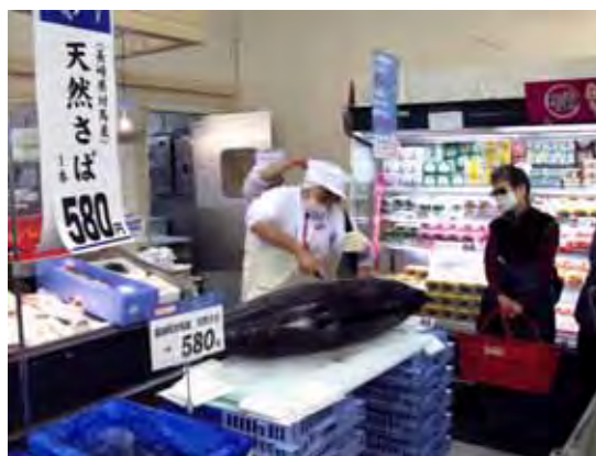
就労風景（鮮魚売場）

直接雇用の高齢者は、中途採用が定年65歳という関係で、採用年齢を概ね63歳程度までとしている。その年齢までの応募者は直接雇用として短時間パートタイマーとなるが、それだけでは充足しないこともあり、シルバー人材センターへの人材斡旋依頼をしたところである。この斡旋で個人事業主として業務委託をしている高齢者は、同センターへの業務依頼の殆どが草刈りや掃除などの業務であり、日数も週に1回というような業務なので満足していない様子であったが、同社の業務については、週1日程度から毎日でも可能という選択肢に幅があるため、喜ばれている。