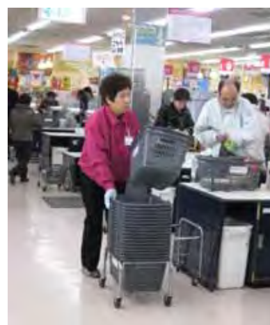
就労風景（カゴ回収）

従来は、8時間単位の勤務シフトにより、3交代で24時間営業に対応していたが、A～F勤務を勤務時間のそれぞれのユニットとして各4時間勤務の時間帯を設定した。パートタイマーをそれぞれの勤務時間ユニットに配置し、毎月・週単位のシフトスケジュールによる勤務体系を設定した。