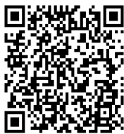
当機構ホームページ (採用情報)

(1) 履歴書・自己紹介書(当機構指定の用紙):当機構ホームページよりダウンロードしてご使用ください。それぞれをA4用紙片面印刷にて作成ください。履歴書には写真1枚貼付。