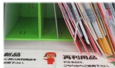
再利用のファイルから使用し 廃棄物を削減