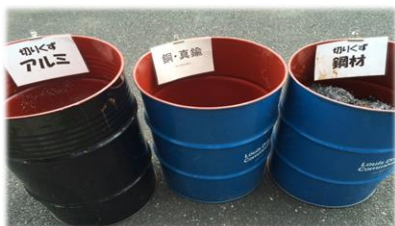
職業訓練で使用した 産業廃棄物の分別