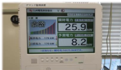
電力使用監視装置による ピークカット対策