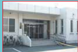
秋田障害者職業センター