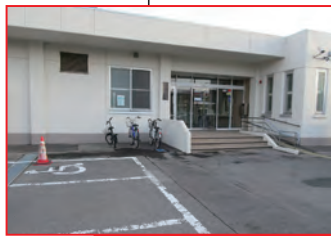
秋田障害者職業センター