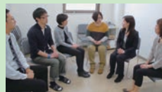
グループミーティング