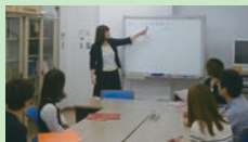
ストレス対処講習