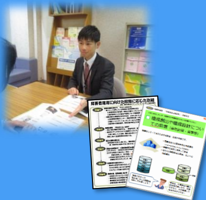
提案型相談・支援ツール