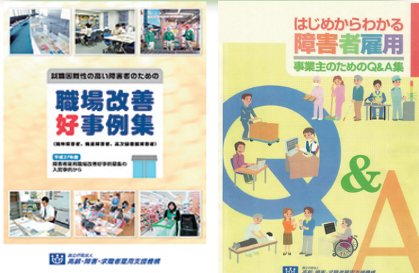
【障害者雇用に関するマニュアル・事例集】

このようなニーズに対しジョブコーチが職場を訪問し、対象者への実際の支援を通して事業主へアドバイスします。