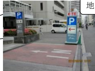
地下駐車場 入り口