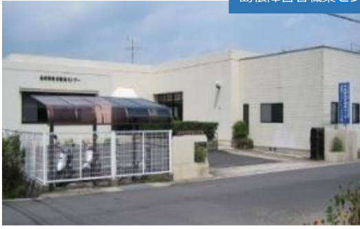
島根障害者職業センター