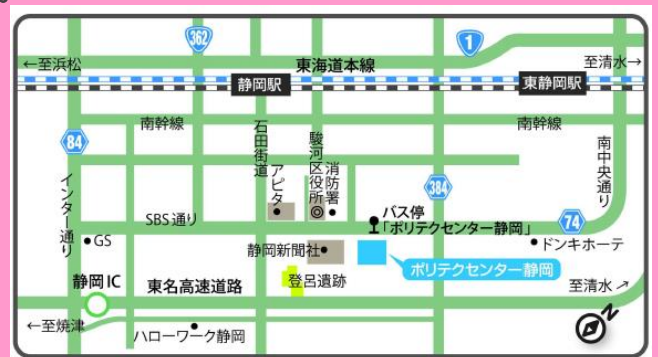
静岡障害者職業センター 地図・交通案内