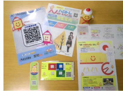
訓練室のハロトレ啓発グッズ（配布資料）