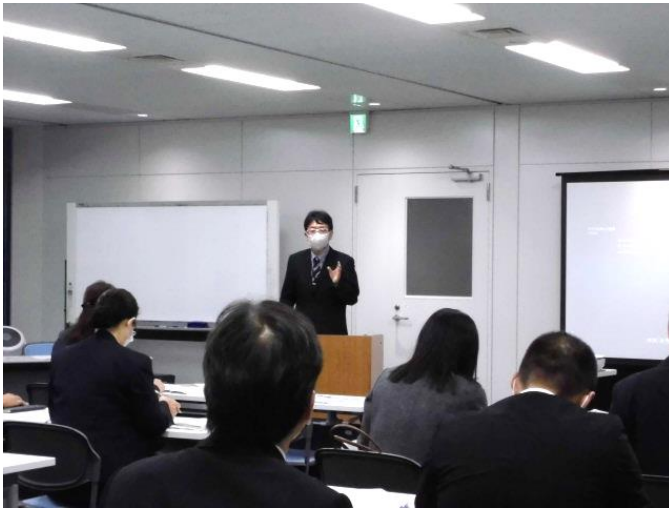
愛知労働局 職業安定部 訓練室長による講義の様子