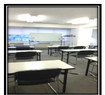
← ↑ 当校の様子