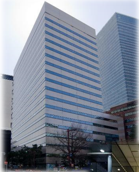
桜通に面した概観