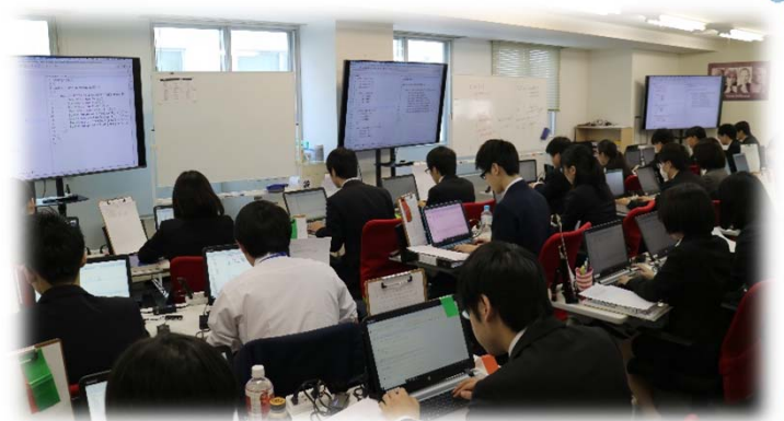
新入社員研修の様子