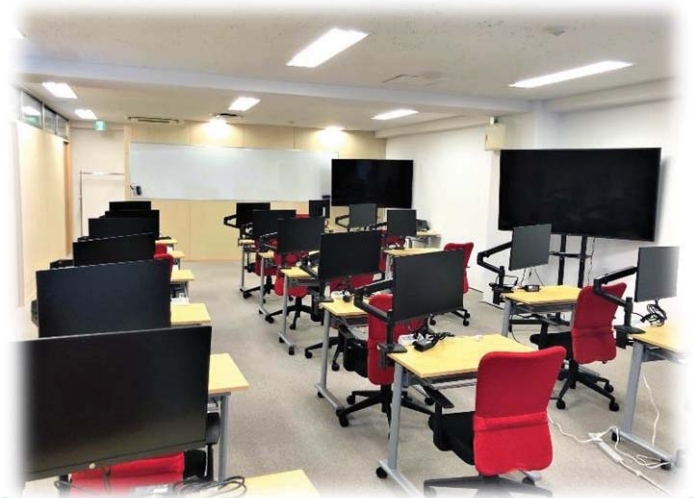
コロナ感染防止対策も実施