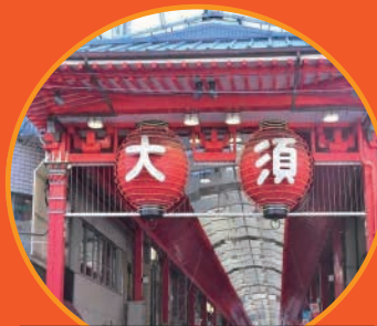
大須商店街スグ横