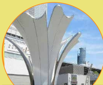
名古屋駅西口徒歩5分