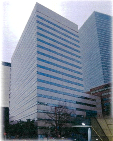
桜通に面した概観