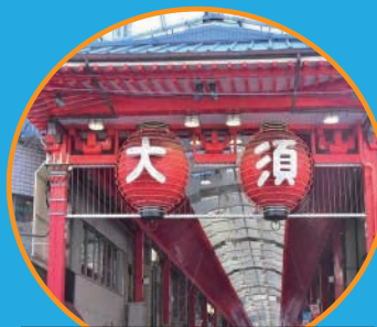
大須商店街スグ横