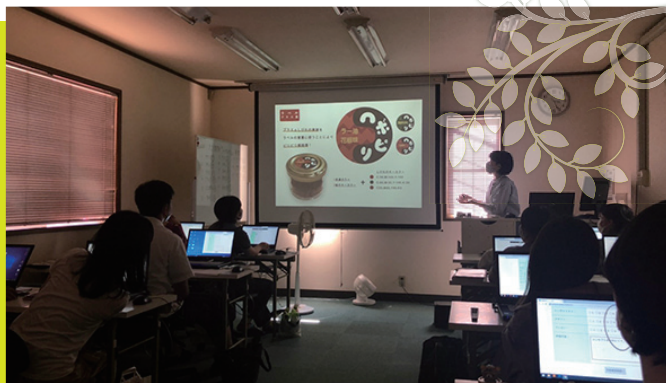
プレゼンテーション

基礎で習う技術やスキルを活かして、独自の実践課題をこなします。商品開発や効率の良いデザインの考案など、課題の時間はあっという間に過ぎていきます。最後にはみんなでプレゼンテーションを行います。