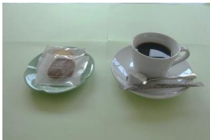
クッキーとホットコーヒー