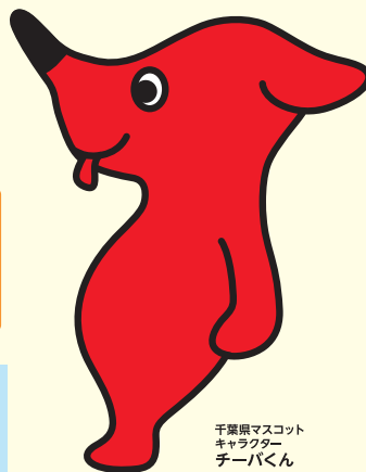
千葉県マスコット キャラクター チーパくん