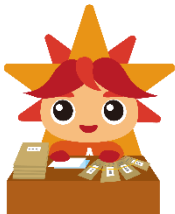
オフィスアシスタント