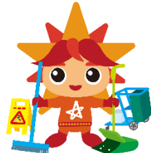
ビルクリーニング