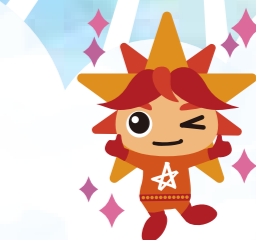
アビリンピックマスコットキャラクター <アビリス>

開催日時 2025 7/5 (土) 10:00~14:00 競技時間 10:30~12:10