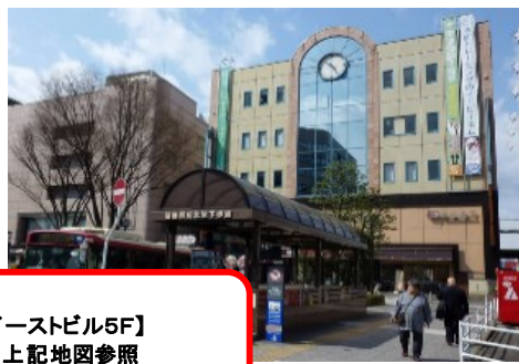
【イーストビル5F】 ※上記地図参照