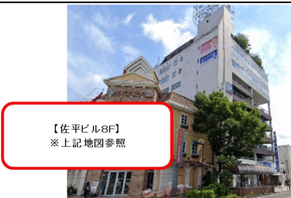
【佐平ビル8F】 ※上記地図参照