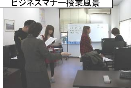
初歩から学ぶパソコン・簿記 基礎科 ビジネスマナー授業風景