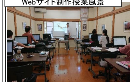
パソコン・Webサイト制作・簿記 実務科 Webサイト制作授業風景