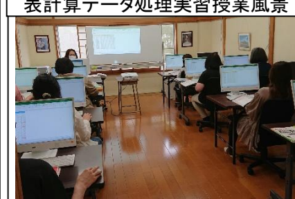
基礎から学ぶパソコン・簿記 実務科 表計算データ処理実習授業風景