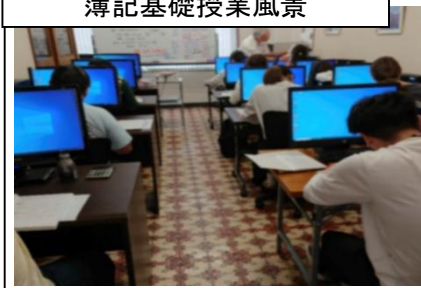
初歩から学ぶパソコン・簿記 基礎科 簿記基礎授業風景