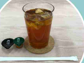
• アイスミルクティー