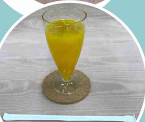
• オレンジジュース