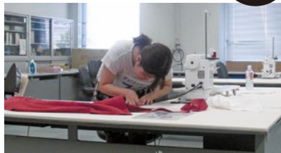
今大会から身体障がい・知的障がい・精神障がいのある方が参加可能

ミシン、アイロン、はさみ、目打ちなどを使い、裁断されたパーツを組み合わせて指定された課題を製作する競技です。仕上がり寸法の正確さ、アイロンやミシンの使い方、作品の出来栄えなどがポイントとなります。