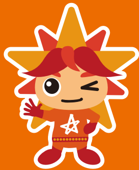
マスコットキャラクター アビリス