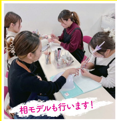
相モデルも行います!