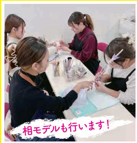
相モデルも行います!