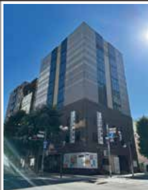
▲H&B プラザビル B2F / AUSPEX 株式会社