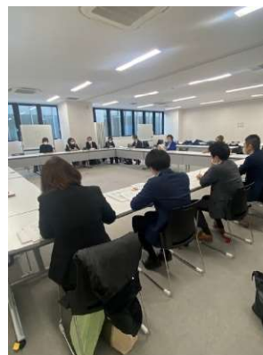
関係者も輪の中に

今回は2回目の開催で就職支援とテーマを絞っての実施ということもあり、各施設からも積極的発言を頂戴いただきました。内容に応じて、労働局、ハローワーク職員からもコメントをもらいました。