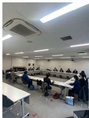
口の字に座席変更

その後、配列を口の字形式に変更し、意見交換を始めました。支部、各施設参加者で口の字の中に着席いただき、本格的な意見交換を始めました。