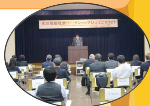
昨年の風景（コロナ対策のため来場者の間隔を確保して開催）