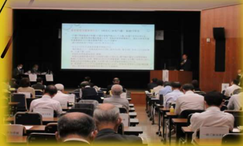
ワークショップひょうご2022

主催 独立行政法人 高齢・障害・求職者雇用支援機構 兵庫支部 共催 兵庫労働局・ハローワーク / 兵庫県 後援 神戸新聞社