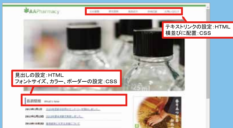
Web制作に必要なHTMLを基礎から習得！

プロのキャリアコンサルタントによる就職支援講義や個別指導を実施します。応募書類の作成や効果的な面接の方法など、就職に関する情報提供・サポートを行います。