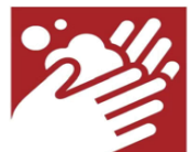
手洗い・消毒 の徹底