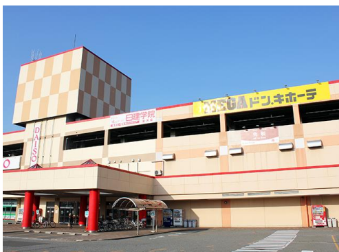
※日建学院金沢校はメガドン・キョーテラパーク金沢2階にあります。 お車でお越しの際は屋上の無料駐車場をご利用ください。