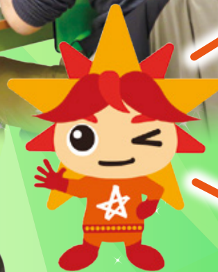
アビリス (アビリンピック公式キャラクター)