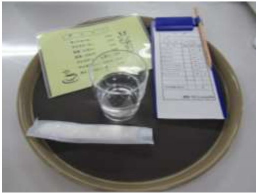
準備 (おしぼり、お冷、メニュー、伝票)