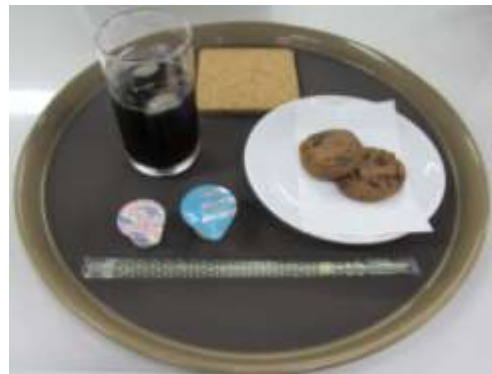
クッキーアイスセット (クッキー+アイスコーヒー)