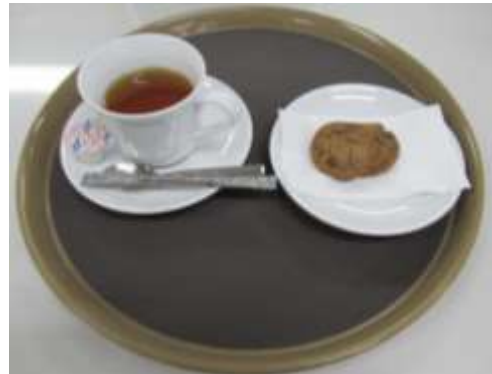
クッキーセット (クッキー+紅茶 ミルク)