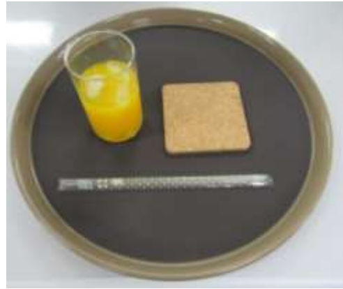
オレンジジュース