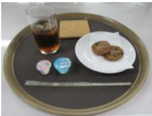
クッキーアイスセット (クッキー+アイスティー ミルク)