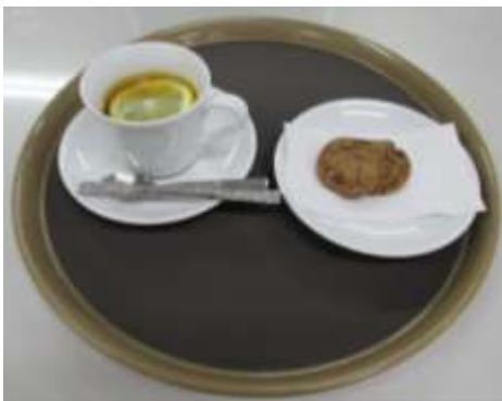
クッキーセット (クッキー+紅茶 レモン)