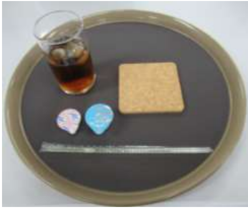
アイスティー (ミルク)