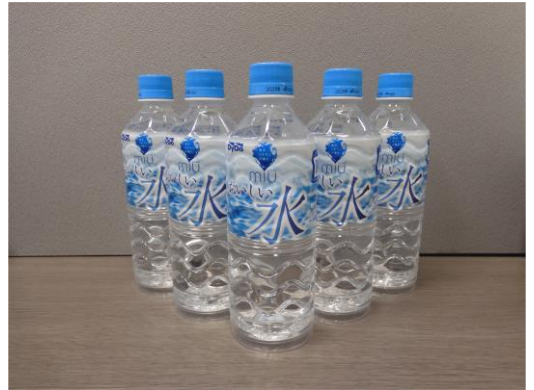
ダイドー・タケナカベンディング株式会社様 「海洋ミネラル深層水M I Uおいしい水」