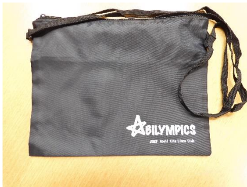
高知北ライオンズクラブ様 「サコッシュ」