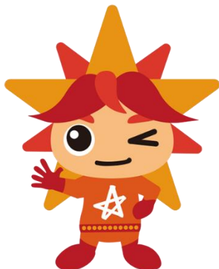
アビリンピック マスコットキャラクター アビリス

◎参加を検討中の皆さんへ：特殊な競技種目かと思いますが、最近では、一般の企業でもチラシやポスターなどの広告物を作れる人を積極的に採用してくれる場合もあるので、ぜひ検討してみてください。