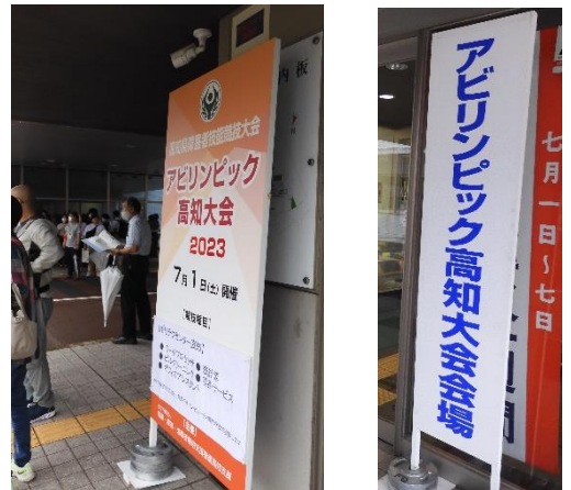
藤本デザイン様により 設営いただいた案内サイン（一部）