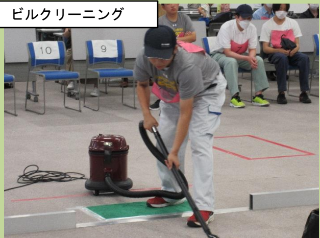
ビルクリーニング