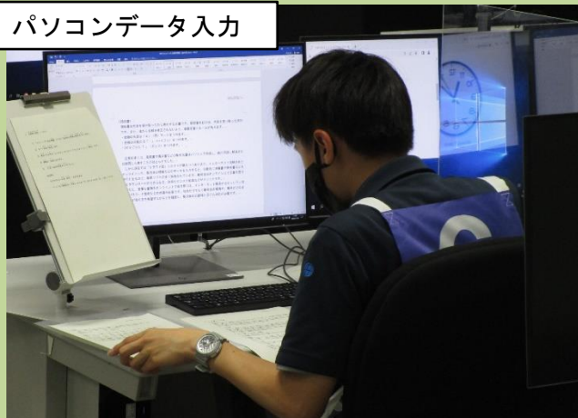
パソコンデータ入力