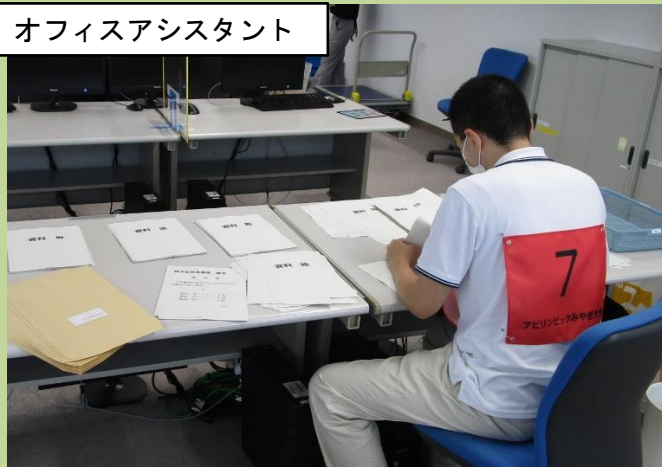
オフィスアシスタント