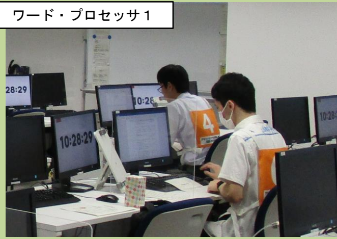
ワード・プロセッサ1