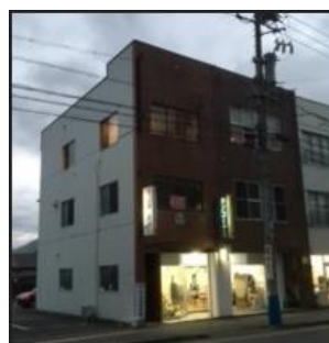
第二教室 訓練施設外観