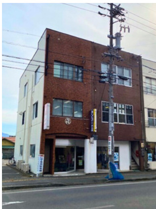
訓練施設外観(第一教室)