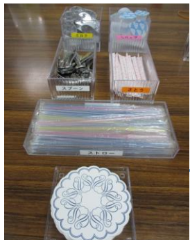
ミルク、砂糖、スプーン、シロップ、コースター、ストロー