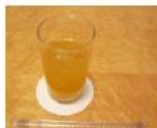
オレンジジュース