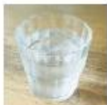
みず お水 ( ひ お冷や)