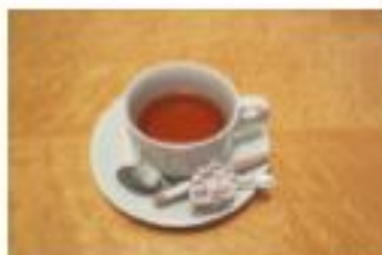
こう 紅 ちゃ 茶